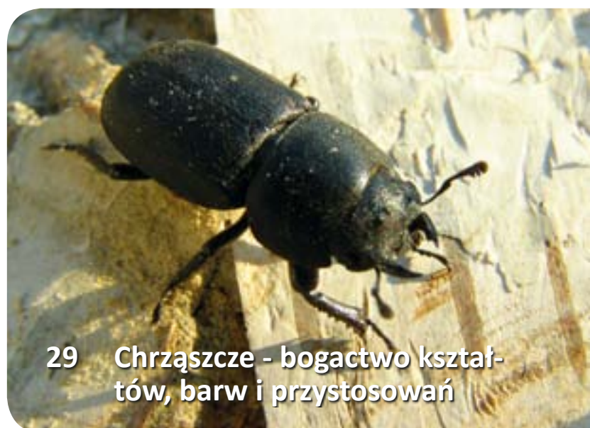
29 Chrząszcze - bogactwo kształtów, barw i przystosowań