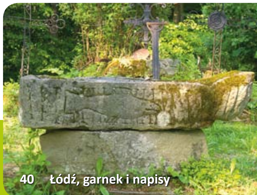
40 Łódź, garnek i napisy