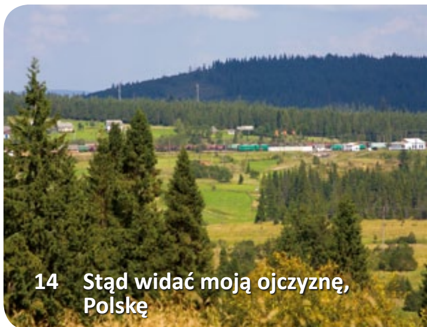
14 Stąd widać moją ojczyznę, Polskę

47 GPS w górach Garmin. Ostateczne decyzje.