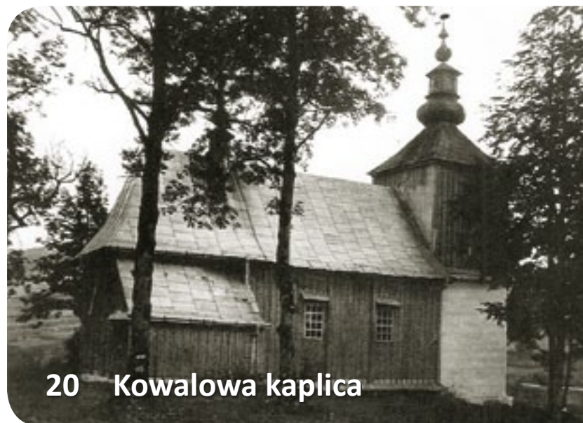
20 Kowalowa kaplica